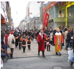
Einblicke vom Kinderumzug am 13.02.2010.....